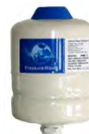
Press Tank 2lt Code: 481500002 netto prijs: €14.25

De Plug&GO ® pomp heeft een innovatieve procedure ter voorkoming van waterlekken in het ledingsysteem. Indien de pomp meer dan 500 keer binnen de 24 uur opstart dan zal de motor automatisch in een "slaapstand" komen. Deze procedure zal oneindig herhaald worden totdat het lek gerepareerd is en de pomp terug normaal kan werken. De pomp kan alleen gereset worden door de voedingsschakelaar AAN / UIT te gebruiken of door de stekker uit te trekken. Indien het lek niet gestopt kan worden en de pomp daardoor te veel starts/stops maakt, wordt aangeraden om een klein drukvat te plaatsen.